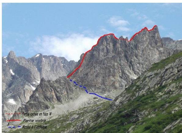
L'arête des Murois

Gîte La Boussole - Hameau des Daurens - 38740 LE PERIER - Gardienne - Emmanuelle BOITHIOT - Tel - 06 03 15 06 78